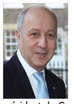
Le président du Conseil constitutionnel Laurent FABIUS