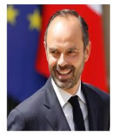
Le Premier ministre Edouard PHILIPPE