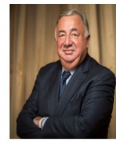
Le président du Sénat Gérard LARCHER