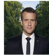
Le Président de la République Emmanuel MACRON