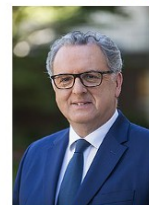
Le président de l'Assemblée nationale Richard FERRAND